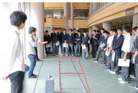
《 鳥取大学 橋の模型展示 》