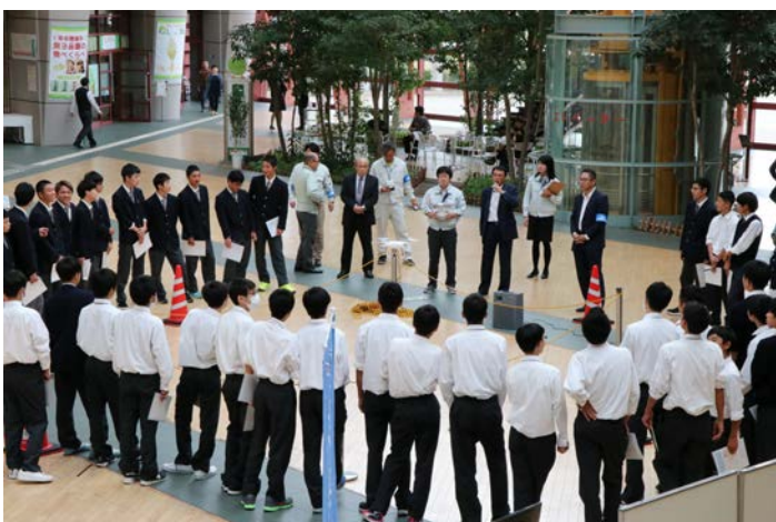
《 鳥取県測量設計業協会 ドローン実演、TS 等機器展示・実演 》