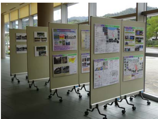
《 鳥取県展示 》

会場外の一角に、鳥取県、鳥取大学、鳥取県測量設計業協会のコーナーを設け、実演展示等を行いました。