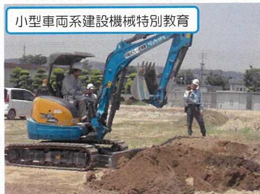
小型車両系建設機械特別教育