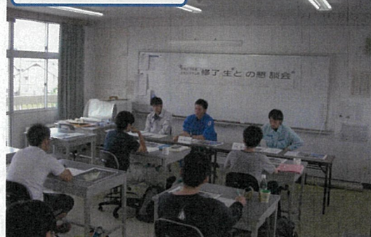
修了生との懇談会