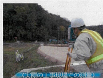
〈実際の工事現場での測量〉