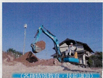
〈各種特別教育・技能講習〉