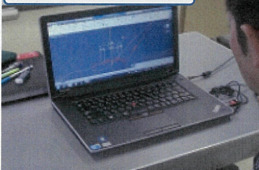
CADソフトを利用した製図