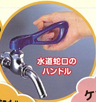
水道蛇口の ハンドル