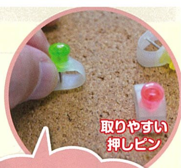
取りやすい 押しピン