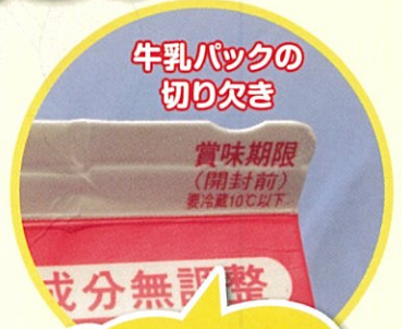
牛乳パックの 切り欠き

ユニバーサルデザイン とは、 年齢や性別、障がいの有無によらず、 はじめから、すべての人にとって、 できるかぎり利用可能になるように、 環境・情報・サービスを設計することです。